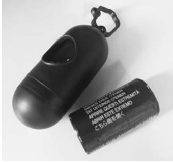
Hundekotbeutel mit „Abrollknochen“

Viele Hundehalter gehen dieser Verpflichtung ordnungsgemäß nach und lassen ihren Hund erst gar nicht die Notdurft dort verrichten bzw. räumen dann den Dreck weg. Manche Hundehalter kümmert dies überhaupt nicht. Hundekotbeutel gibt es kostenlos, im Rathaus, für jeden Hundehalter. Machen Sie davon Gebrauch und greifen Sie reichlich von den Beutellagen ab.