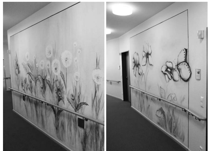
Farbenfroh: die bemalten Wände im Pflegeheim sind ein echter Hingucker...

Und der Besuch bestätigte dies wieder eindrucksvoll: Es wurde ein Rekorderlös in Höhe von 3.500 Euro erwirtschaftet. Dann kam Corona und auch dem Weihnachtsmarkt in Scheer wurde damit bislang eine weitere Ausführung verwehrt. Auch konnte der stattliche Erlös, an das Pflegeheim Scheer/ den Kindergarten Heudorf und die Gräfin-Monika-Grundschule Scheer, des Weihnachtsmarktes aus 2019 noch nicht an den Mann gebracht werden. Und so wurde es September 2021 bis zunächst das Pflegeheim St. Wunibald den ersten Teil der Zuwendung in Höhe von 800 Euro abgerufen hat. Damit soll ein Teil der Aufwendungen der Neugestaltung der Flure bestritten werden. Die Malerinnen Claudia Heinemann und Anke Gallasch (beide aus der Nähe von Aulendorf) verschönerten die Wände. „Wir freuen uns sehr über die Zuwendung, diese hat die Beauftragung der Damen erst möglich gemacht. Das Gemalte ist für unsere Bewohner ein Blickfang und wir hoffen, auch bald wieder für die vielen Besucher“ freut sich die Leitung des Hauses St. Wunibald, Frau Meryem Gottschalk-Dikbas mit ihrem Team.