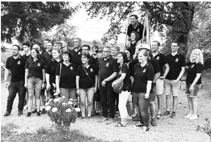
Die Musikerinnen und Musiker der Stadtkapelle im Biergarten vom Gasthaus „Traube“ in Wielandsweiler