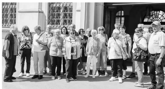
Insgesamt 25 Senioren nahmen am Ausflug teil.

Zum Schluss besichtigten wir das Hopfengut Nummer 20. Eine Privatbrauerei, die alles selber herstellt. Wir erfuhren viel über die mühselige Hopfenernte und über das Bierbrauen. Nach der Führung gab es zunächst eine Bierprobe mit vier unterschiedlichen Bieren und danach noch Kaffee und Kuchen.