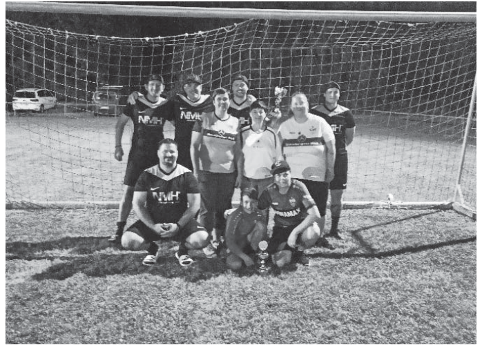
Die Spieler/innen der beiden siegreichen Mannschaften: Firma NMH und "die wilden Heuschrecken"

Ein besonderer Dank gilt dem Bauhof der Stadt Scheer für Ihre tatkräftige Unterstützung sowie allen Sponsoren, ohne die es ein-fach nicht geht. Teilnehmer und Gäste ließen den Turniertag erst lange nach dem letzten geschossenen Elfmeter ausklingen. Nächstes Jahr gibt es auf jeden Fall ein Wiedersehen.