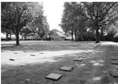
100 Jahre Kriegsgräberstätte Menen/Belgien. Menen ist mit 47.911 Toten aus mehr als 10 Ländern die größte deutsche Kriegsgräberstätte des I. Weltkrieges.