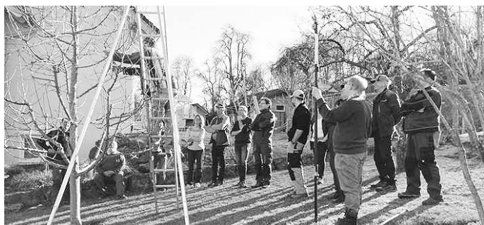
Viele Interessierte lernten die Schnittregeln für Obstbäume

„Kannst Du mal schnell meine Obstbäume schneiden?“ Diese Illusion wurde gründlich zerstört und es dämmerte so manchem, wie viel Arbeit doch in so einem Baumschnitt steckt.