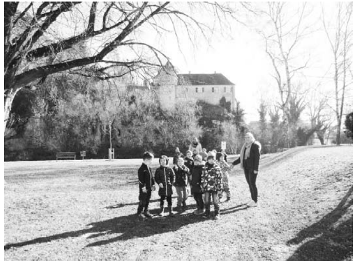
Auf dem Rückweg gings zum alten Sportplatz mit schönstem Blick auf die Villa Bartelstein.