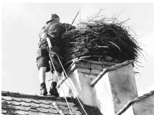
Herausnahme der Störche