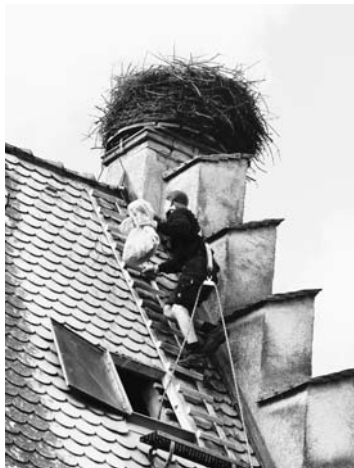
Ersteigen des Nestes