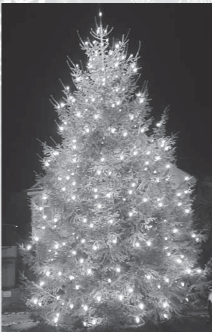
Christbaum in Scheer