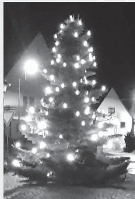
Christbaum in Heudorf

Vielen herzlichen Dank für die Christbaumspenden in Scheer und Heudorf.