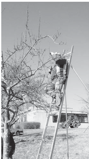
Das fleissige Team beim Baumschnitt.

Während die einen fleißig schnitten, trugen andere die Zweige zusammen und versorgten das Team mit Kaffee, Leberkäs-Weckle und Kuchen.