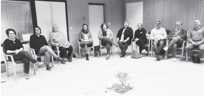
Die Engagierten aus Mengen und Scheer nahmen viel aus dem Workshop mit.