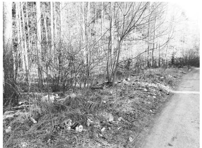
Ob neben Altglascontainern, im Wald oder am Straßenrand: Wild entsorgter Müll kostet den Landkreis nicht nur viel Geld, sondern kann zum Beispiel für Tiere auch schnell zur tödlichen Falle werden.

Wer selbst illegale Müllablagerungen entdeckt hat, kann sich an das Ordnungsamt der jeweiligen Gemeinde wenden. Hinweise auf wilden Müll außerhalb bebauter Ortsteile nehmen die Polizei, die Kreisabfallwirtschaft und die Internetrechtsbehörde des Landratsamts entgegen. Werden die Täter ermittelt, droht ihnen ein Bußgeld von bis zu 100.000 Euro.