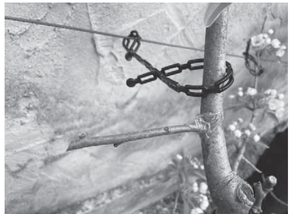
Ein Loch bohren in den Stamm, Zweig einsetzen, fertig.